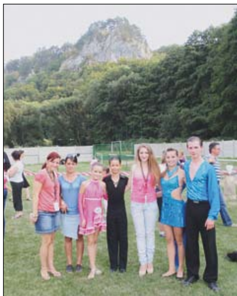
TPŠ Focus Moldava nad Bodvou