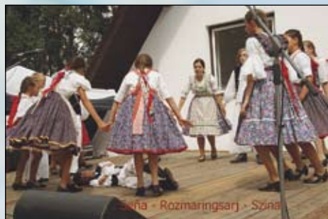
Seňa - Rozmaring - Szina