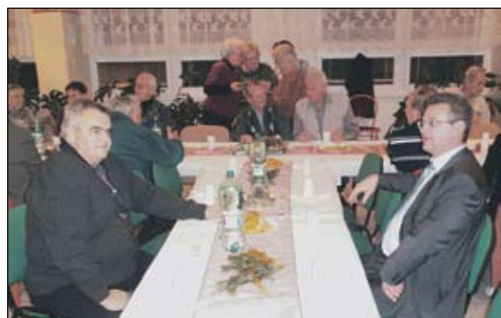
Mikulášske posedenie dôchodcov