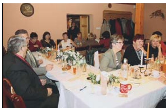
Katarínske posedenie - Únia žien v Jasove