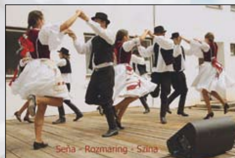
Seňa - Rozmaring - Szina