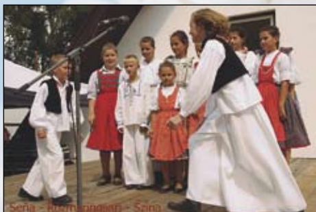
Seňa - Rozmaring - Szina