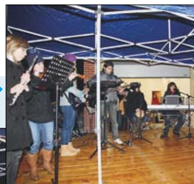
Jasovský vianočný stromček- deti z MŠ