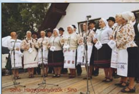
Seňa - Hagymányórzók - Szina