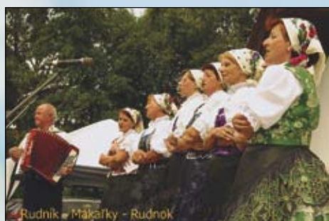
Rudník - Mákalky - Rudník