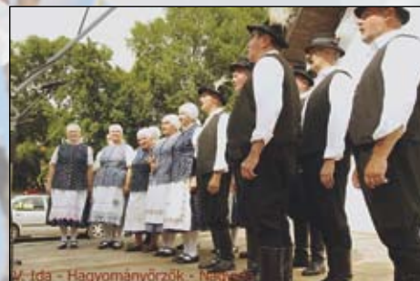
V. tda - Hagymányórzók - Nagy