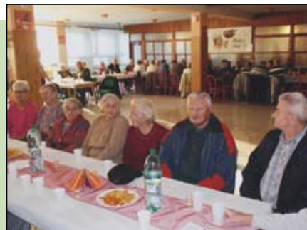
Úcta k starším