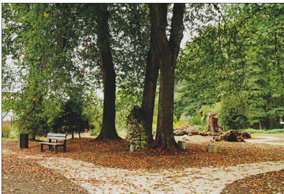
Oddychový park Bubics liget

Viete, že za CO skladosom sa nachádza veľmi pekný rybník? Pekných zákutí je tu viac.