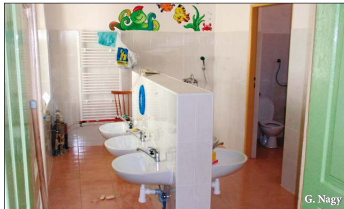
Zrekonštruovaný interiér MŠ Jasov 62