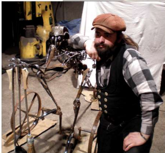
Autor s „Motokomorníkom“