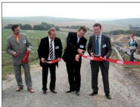
18. 9. '09. Otvorenie druhej kazety skládky odpadov v Jasove – Deň otvorených dverí