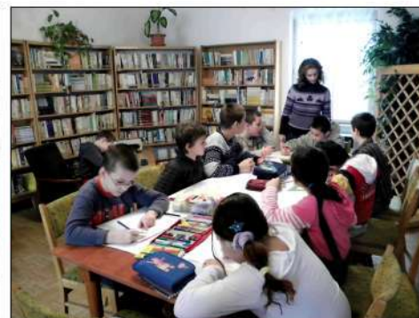
4. 12. '09. ZŠ Jasov – návšteva Obcejnej knižnice – kreslíme a píšeme želania Ježiškovi