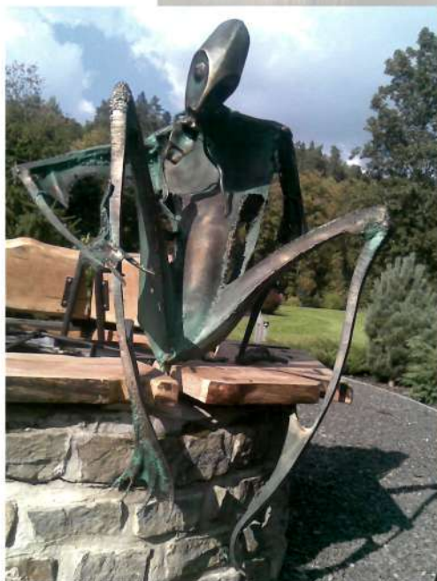
Vodník na studni v Levoči