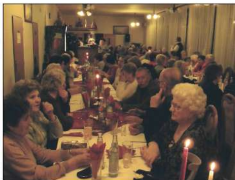
4. 12. '09. Mikulášske posedenie, organizované Klubom dôchodcov v Jasove