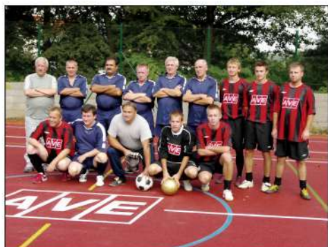
18. 9. '09 – úvodný zápas pri príležitosti otvorenia multifunkčného ihriska