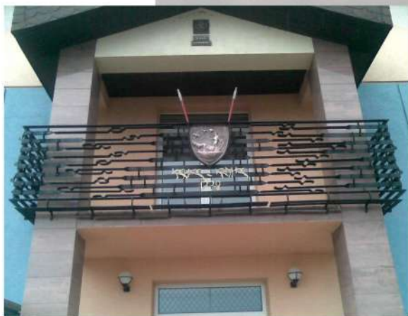
Balkón – OU Kechnec