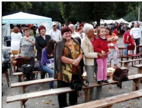
5. Jasovské oslavy – Ani búrkové mračná neodohňali verné obcenstvo