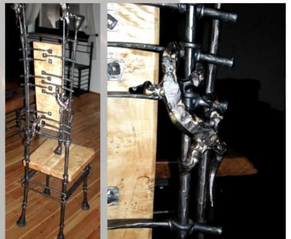
Stolička karieristka – detail salamandry