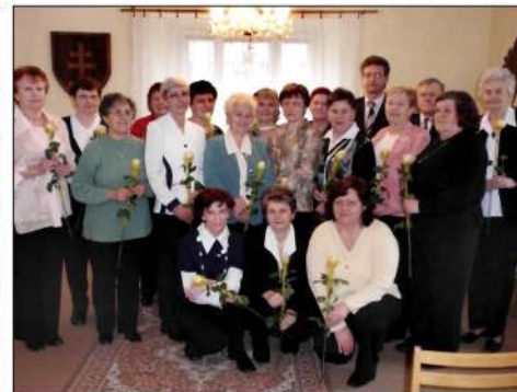
27. 3. '09. Obec si spomenula na Deň učiteľov