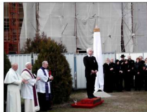
CSEMADOK A SMK – Slávnostné odhalenie pamätného stĺpa na pamiatku revolúcie 1848-49