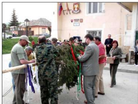
30. 4. '09. Stavanie Mája pred Obecným úradom v Jasove