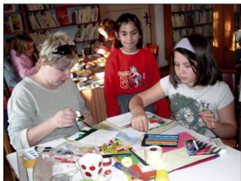
Klub mladých čitateľov – Jedna z piatkových aktivít – výroba vianočných pohľadníc