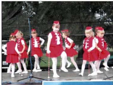
29. 8. '09. Jasovské oslavy – Skvelé vystúpenie mažoretiek z MŠ Jasov