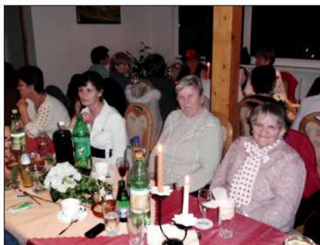
8. 3. '09 Medzinárodný deň žien, organizovaný Úniou žien v Jasove