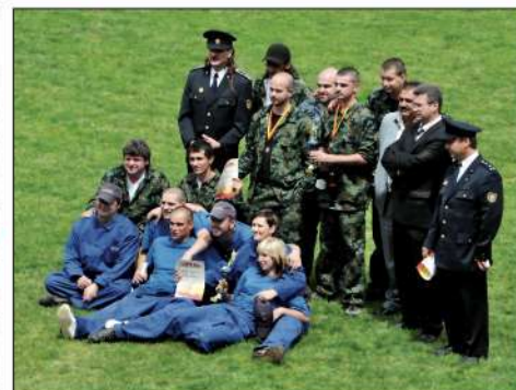
13. 6. '09. Dobrovoľní hasiči počas aktivít pri vysvätení sochy sv. Floriána